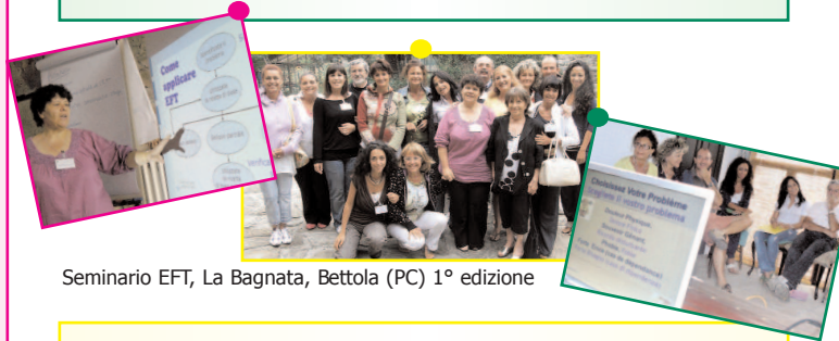
Seminario EFT, La Bagnata, Bettola (PC) 1° edizione

L'effetto della tecnica rasserena e permette di pensare più chiaramente al proprio problema. Nella maggior parte dei casi, l'emozione pesante è significativamente ridotta o semplicemente eliminata e la sofferenza fisica conseguente scomparsa. La memoria dell'evento è conservata, ma non ha più alcun'intensità negativa. Vi sentirete liberati.